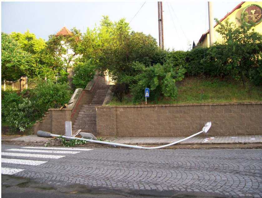
Následek vichřice v červnu 2008

Probíhá i pasportizace veřejného světlení; ukazuje se, že kromě dostavby osvětlení bude potřebná i rozsáhlá rekonstrukce stávajících sloupů i vedení. Při nárazových větrech již dochází ke zlomům sloupů v částech, které jsou zčásti zrezivělé.