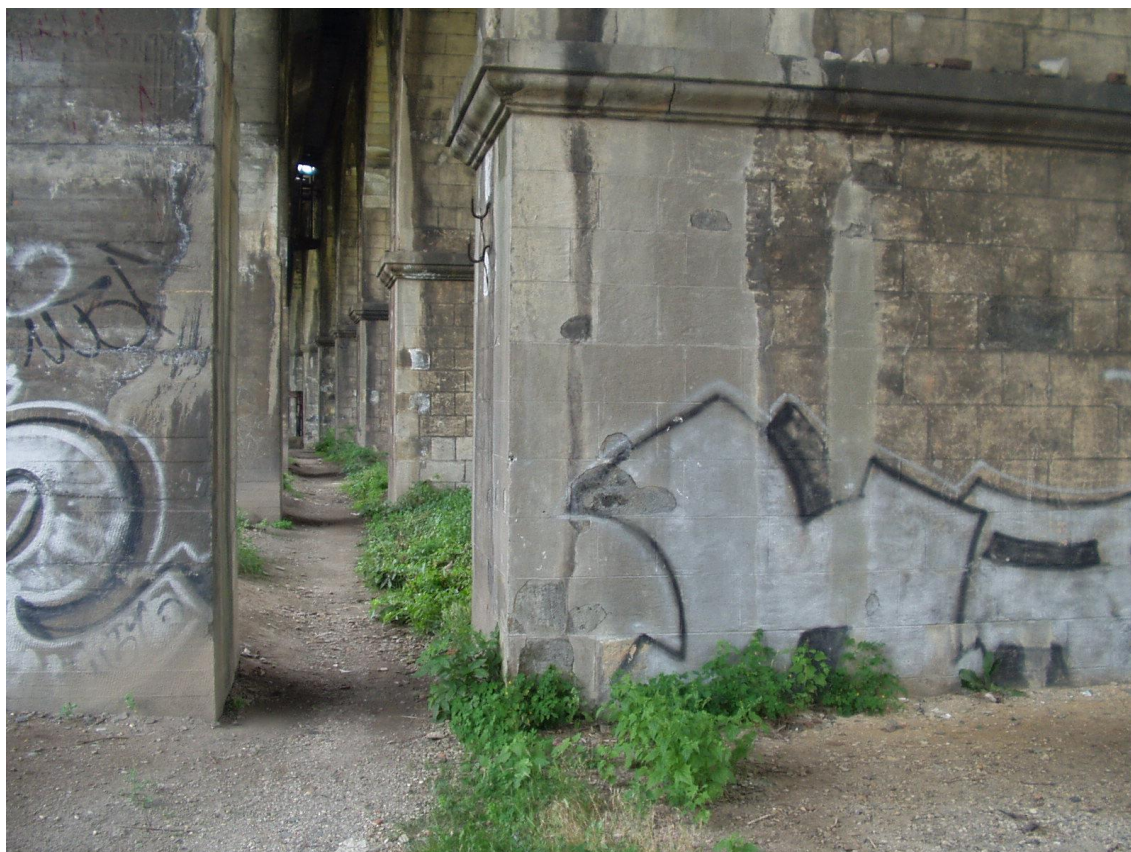
Železniční viadukt postavený podle projektu pana Pernera: budoucí turistická atrakce ?

Železnice je navedena do města od východu přes viadukt a následně v délce rámcově 1,5 km město brutálně protíná; trať svým průběhem a prostorovou konfrontací s uliční sítí a zástavbou ovlivňuje uspořádání města.