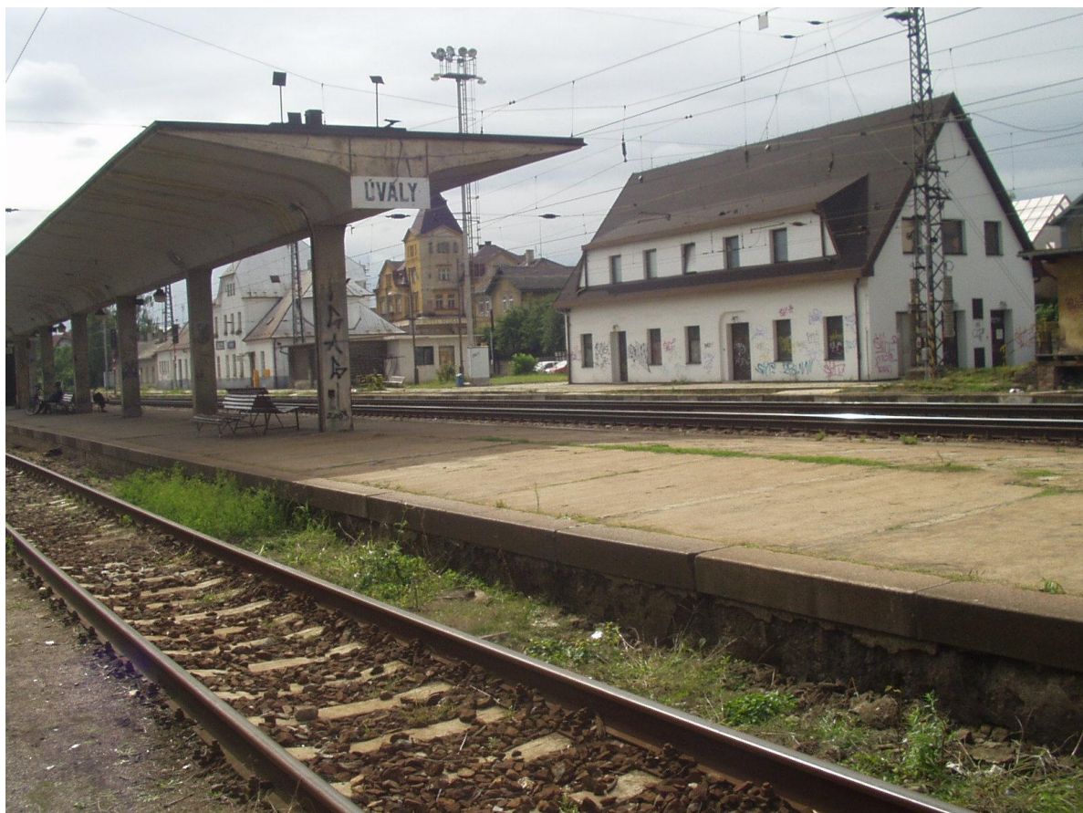
Úvalské nádraží před rekonstrukcí.

Závažnou chybou bylo, že město Úvaly, v průběhu přípravy investiční akce „rekonstrukce železničního koridoru nepožadovalo začlenit do této investiční akce řešení parkování v oblasti nádraží – a zpracování kompletní studie EIA.