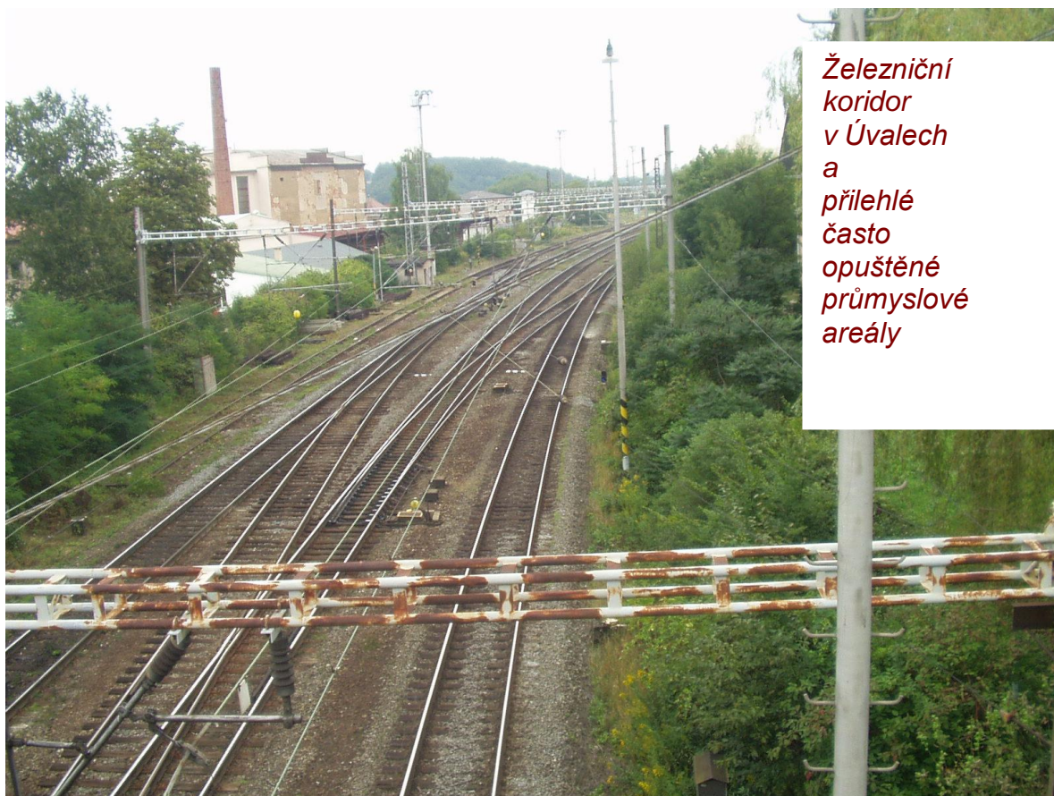
Železniční koridor v Úvalech a přilehlé často opuštěné průmyslové areály

Řešení této problematiky – i pro měst přínosné využití jiných ploch přilehlých k drážnímu koridoru bude však narážet na majetkoprávní vztahy. Základním úkolem však bude „ukotvit“ nádražní koridor k městu, tedy formulovat potřebné plochy pro železnici a její zázemí, pro návazné dopravy (vč. parkovišť) a plochy pro rozvojovou zástavbu.