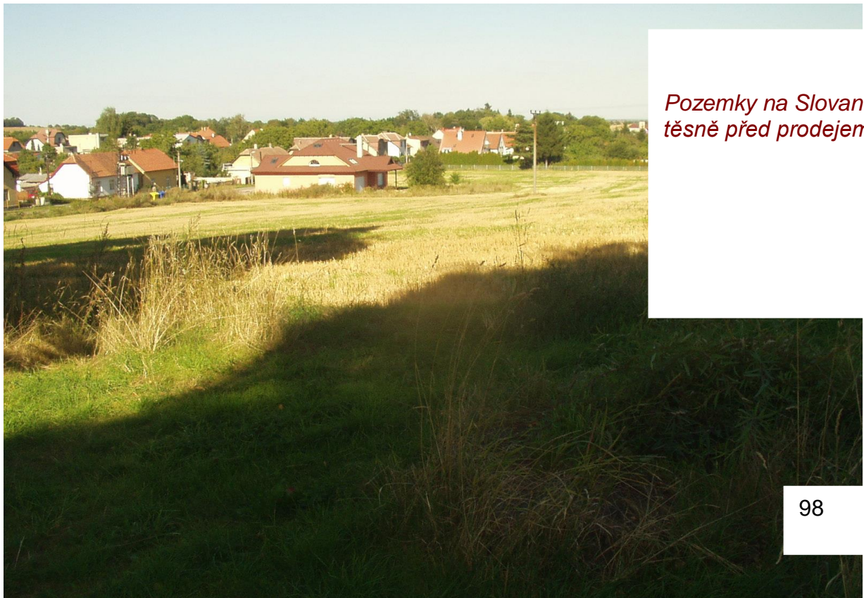
Pozemky na Slovanech těsně před prodejem