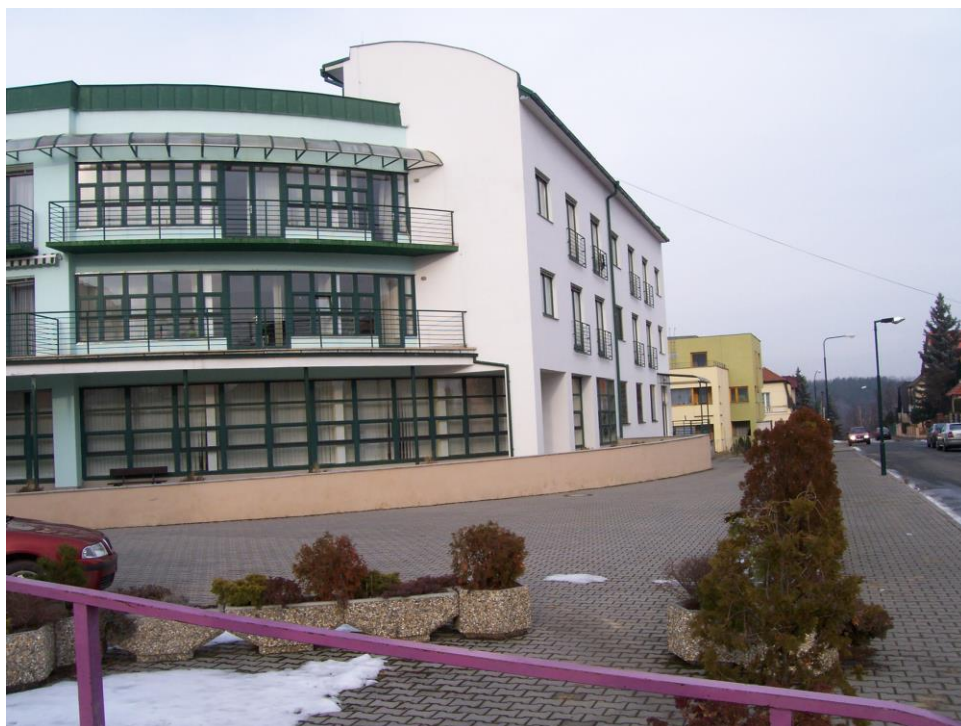
Úvaly: Domov důchodců a v pozadí dům s pečovatelskou službou